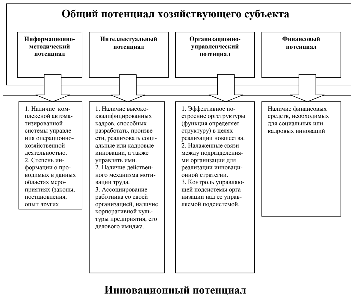
Рис. 1. Структура инновационного потенциала, необходимого для изменения социальных отношений хозяйствующего субъекта (социальные или кадровые инновации)

Базисным условием активизации инновационной деятельности хозяйствующих субъектов является применение методов управления экономическим, профессиональным и общественным поведением работника, направленных на достижение стратегических целей развития потенциала хозяйствующего субъекта, региона и общества (рис. 1).