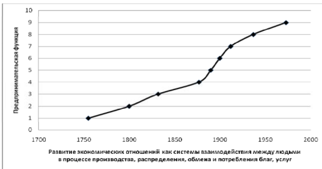
Рис. 1. Тренд развития предпринимательской функции

более высокими темпами достигается развитие экономической системы, тем большее количество ресурсов используется производительно, тем выше их занятость в экономике и тем она масштабнее и целостнее.